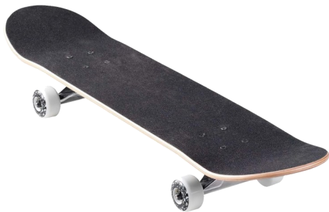
Planche à roulettes